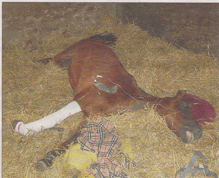
Providence a subi une lourde intervention chirurgicale pour rétablir son antérieur déformé, et malheureusement elle devra porter une prothèse jusqu'à la fin de ses jours