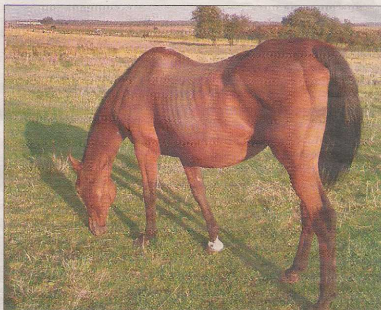
Haras d'Or a échappé de justesse de l'abattoir; il coule aujourd'hui des jours paisibles dans une prairie de Rezonville, près de Metz